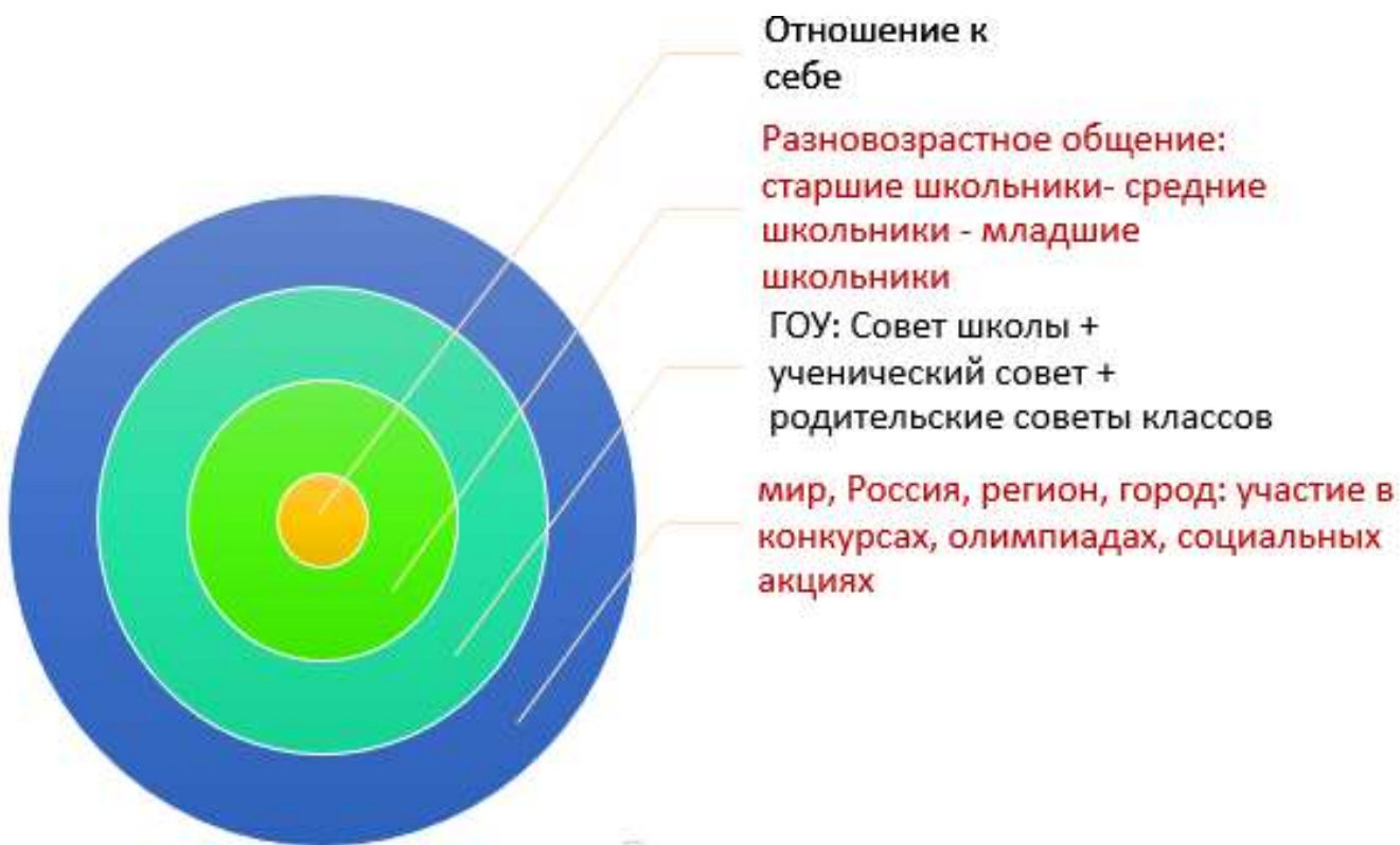
Рис. №1. Модель воспитания и социализации обучающихся Школы через развитие отношений

На рис. №1 изображена модель воспитания и социализации обучающихся через развитие отношений старших подростков на разных уровнях.